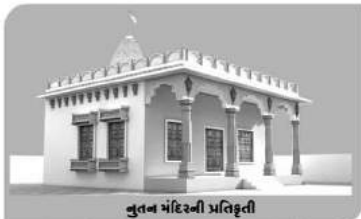
નુતન મંદિરની પ્રતિકૃતિ

બગીચાની નીકમાં નાખેલું પાણી જેમ આખા બગીચાને લીલોછમ રાખે છે તેમ એ જમાનાના વડીલોએ પોતાની સંપત્તિનો સદ્વ્યય કરી કુળદેવતા અને કુળદેવીના આ ક્ષેત્રને તરતો રાખ્યો છે. સુંદર-સુઘડ અને સ્વચ્છ વાતાવરણમાં બનાવેલ મઠમાં પ્રવેશતા આપણા ગોઠિયાભાઈઓ અને નિયાણીબેનોને એક અદ્ભૂત અનુભૂતિ થતી હતી... એ મઠ આજે નવા અવતાર સાથે ભવ્યાતિ ભવ્ય અને અલૌકિક મંદિરનું સ્વરૂપ લેવા જઈ રહી છે ત્યારે આપણા પૂર્વજોએ જીવંત રાખેલ એ મઠને ક્યારેય નહીં ભૂલાય.